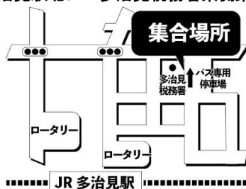
JR 多治見駅北口・多治見税務署東側にてお待ちください。