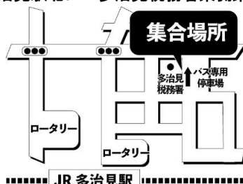
JR 多治見駅北口・多治見税務署東側にてお待ちください。