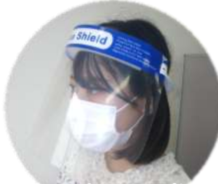
フェイスシールドをご用意致しております