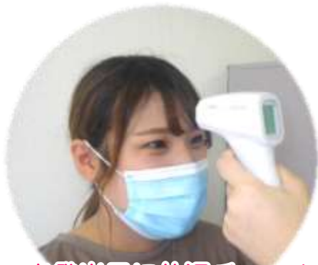
出発当日に体温チェックを実施します