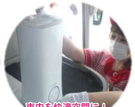
車内を快適空間に！ 弱酸性の次亜塩素酸水を噴霧して車内を除菌します